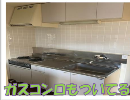
ガスコンロもついている