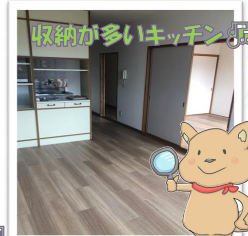
収納が多いキッチン